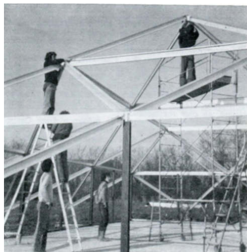
Maison des Jeunes - Le 4-3-78