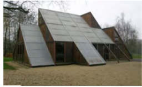
modèle SCAC Ed-Kit