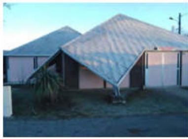
modèle SEAL 1ère série