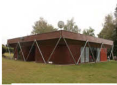
modèle BSM 1ère série