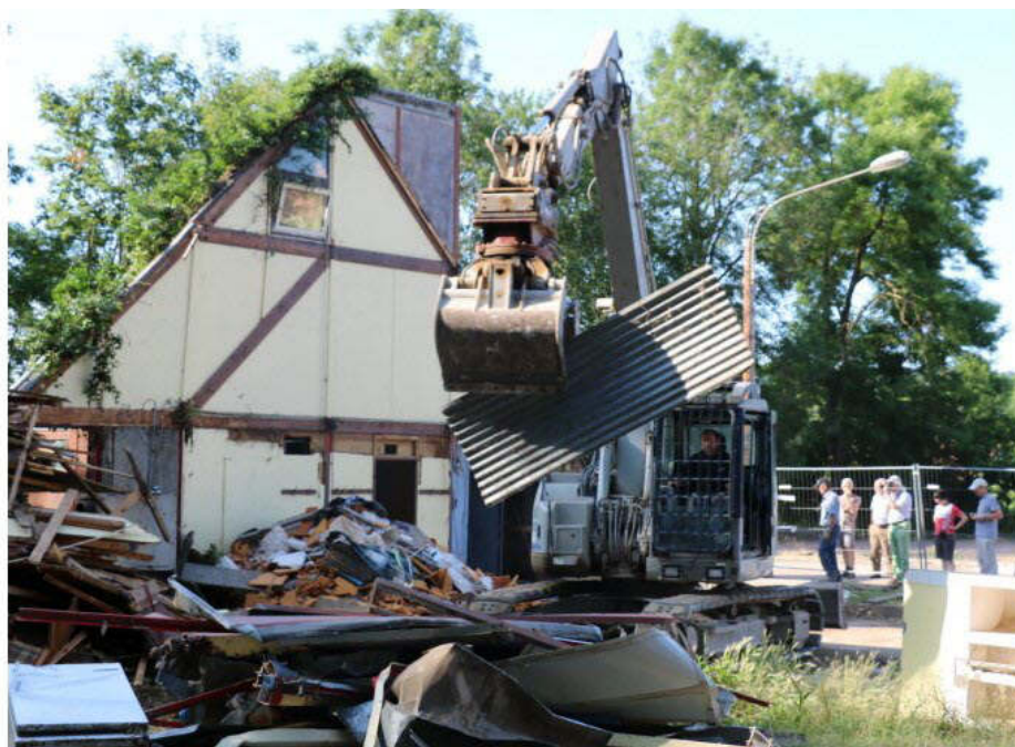
La démolition a eu lieu sous le regard du maire, d'élus et de Lorriots

Par Le Républicain Lorrain - 08 juil. 2019