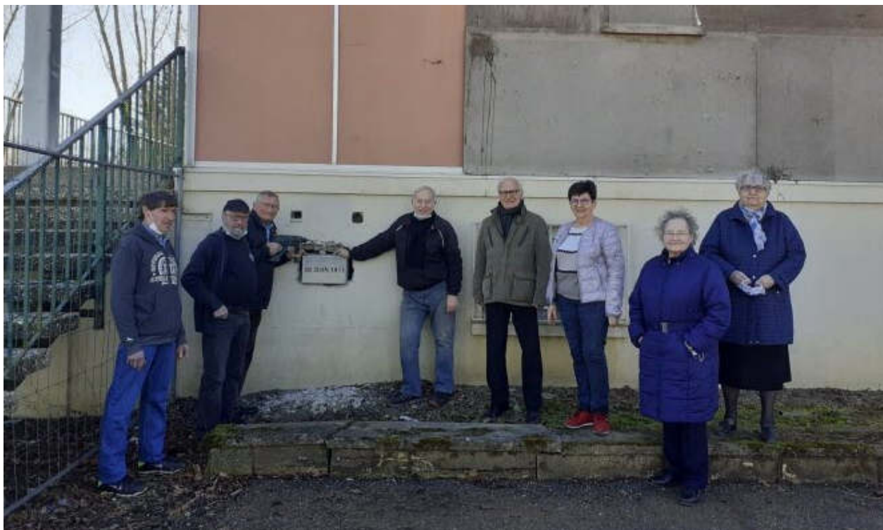
Les bâtisseurs se sont réunis pour revoir le « trésor » enfoui dans une pierre scellée et contenant notamment le discours et les pièces de monnaie de l'époque.

Par Le Républicain Lorrain - 03 mars 2021