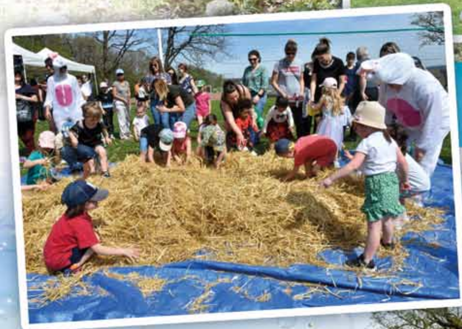
Une chasse aux œufs sous le soleil